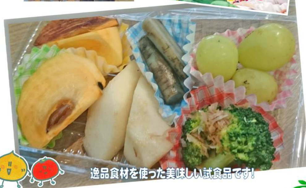
逸品食材を使った美味しい試食品です！